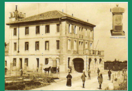
DOGANA TRIVIGNANO UDINESE

Der Schutz unserer ethnischen, historischen und kulturellen Identität ist die Voraussetzung für das Kreieren eines geeinten und freien Europas, hinsichtlich der Geschichte aller zugehörigen Völker und für die Überwindung aller momentanem Differenzen und Trennungen.