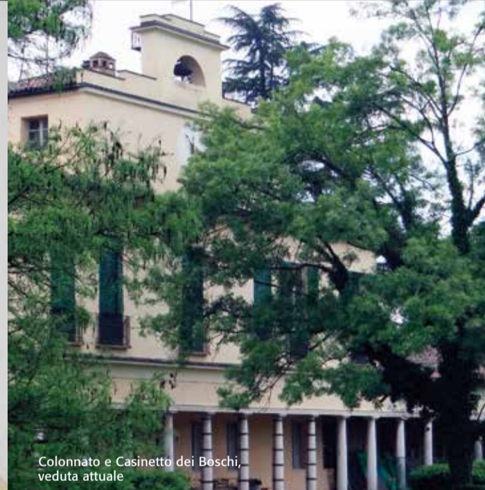
Colonnato e Casinetto dei Boschi, veduta attuale