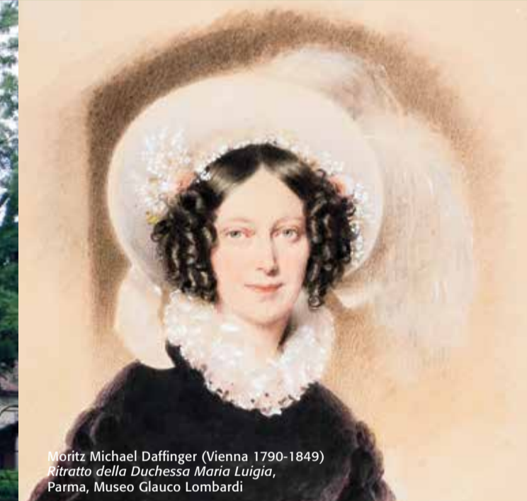
Moritz Michael Daffinger (Vienna 1790-1849) Ritratto della Duchessa Maria Luigia, Parma, Museo Glauco Lombardi

Sabato 10 Settembre 2016 – ore 17.30 Sala Convegni Rocca San Vitale – Sala Baganza (PR)