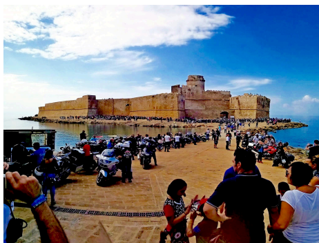
Le Castella, Destinazione Segreta del 2016