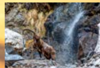
Luca Bentoglio Doccia primaverile