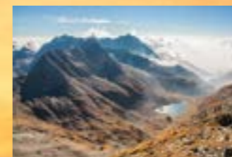
Marco Pendezza Dove nasce il fiume Serio