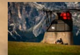
Dario Zecchin Il Riposo Del Guerriero