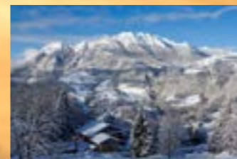
Angelo Corna Brumano e Resegone