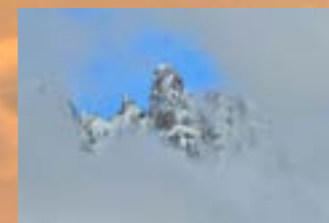
Vittorio Ricci Eastern Dolomites