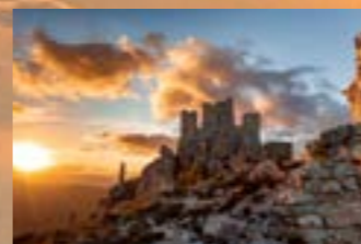
Silvano Paiola The Lord of the Rings