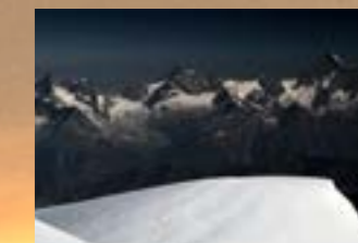
Paolo Mozzo Men & The Alps