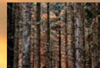
Paolo Mozzo La cattedrale