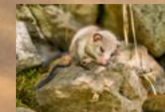
Mauro Bertolini Come un ghio