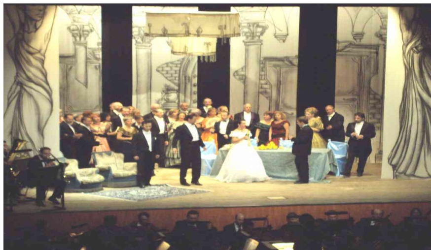
Gallarate 2008 Traviata

Nel 2009 ha allestito Traviata con scene e costumi al teatro Gassman di Gallarate. L'orchestra ha eseguito l'integrale delle sinfonie e dei concerti di Beethoven, l'integrale dell'Oratorio di Natale di Bach e l'integrale dei concerti per oboe, violino e clavicembalo di Bach. Nel 2010, nell'ambito del bicentenario Chopin, ha avuto come direttore ospite e pianista Maurizio Zanini con il quale si è esibita, fra l'altro, nella prestigiosa stagione degli Amici della Musica di Sondalo ed ha eseguito le Variazioni su là ci darem la mano di Chopin con il pianista Roberto Plano . Nell'aprile