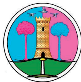
Commissione Pari Opportunità Collesalveti