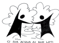
CI SIA ACQUA AI DUE LATI