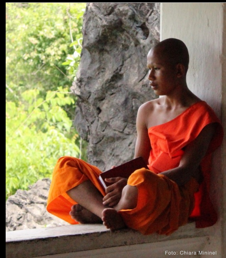
GRAFICA: FABIO G. CUCUT

VIAGGIARE E FOTOGRAFARE PER CONOSCERE IL MONDO