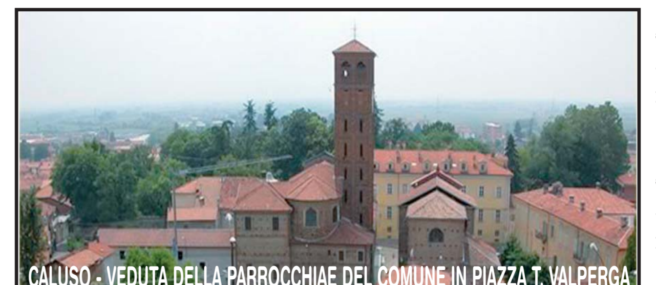
CALUSO - VEDUTA DELLA PARROCCHIAE DEL COMUNE IN PIAZZA T. VALPERGA

SERVIZIO IN COLLEGAMENTO CON FRAZIONI E CAPOLUOGHI A CHIAMATA DAL LUNEDI' AL VENERDI' - DALLE ORE 8,15 ALLE ORE 12,15 E DALLE ORE 14,00 ALLE ORE 16,00 - TELEFONANDO AL NUMERO VERDE 800-213343 LA GIORNATA PRIMA DEL VIAGGIO DALLE 9,00-12,00 / 14,00-16,00