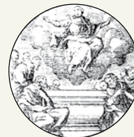
Assunzione di Maria